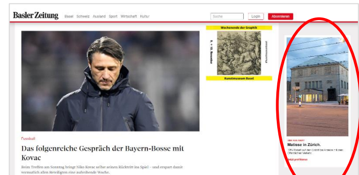
Beispiel Kunst und Kultur